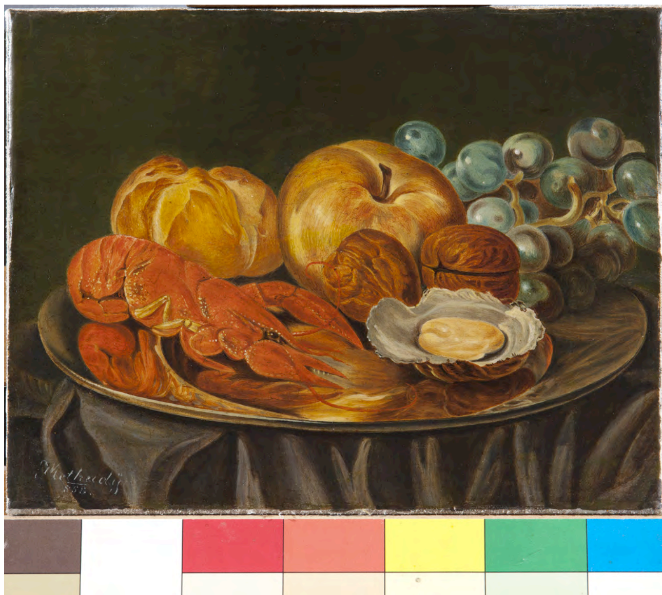
Slika nakon obavljenih radova

Sloj boje koji se ljuštio, podljepljen je pomoću jesetrinog tutkala i podtlaka na niskotlačnom toplinskom stolu. Slika je ljepilom BEVA 371 dublirana na novo laneno platno. Uklonjen je sloj površinske nečistoće i diskoloriranog terpenskog laka. Oštećenja su kitana polivinil alkoholnim vezivom i bolonjskom kredom. Slika je napeta na klinasti podokvir formata 20x26 cm. Sloj boje je intenziviran i izoliran mastiksom. Retuširano je Maimeri restauro bojama vezanim mastiksom. Završna zaštita i završni mat efekt postignuti su Maimeri mat lakom.