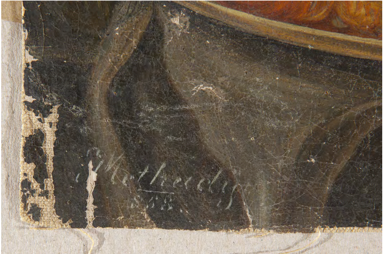
Potpis prije radova na slici