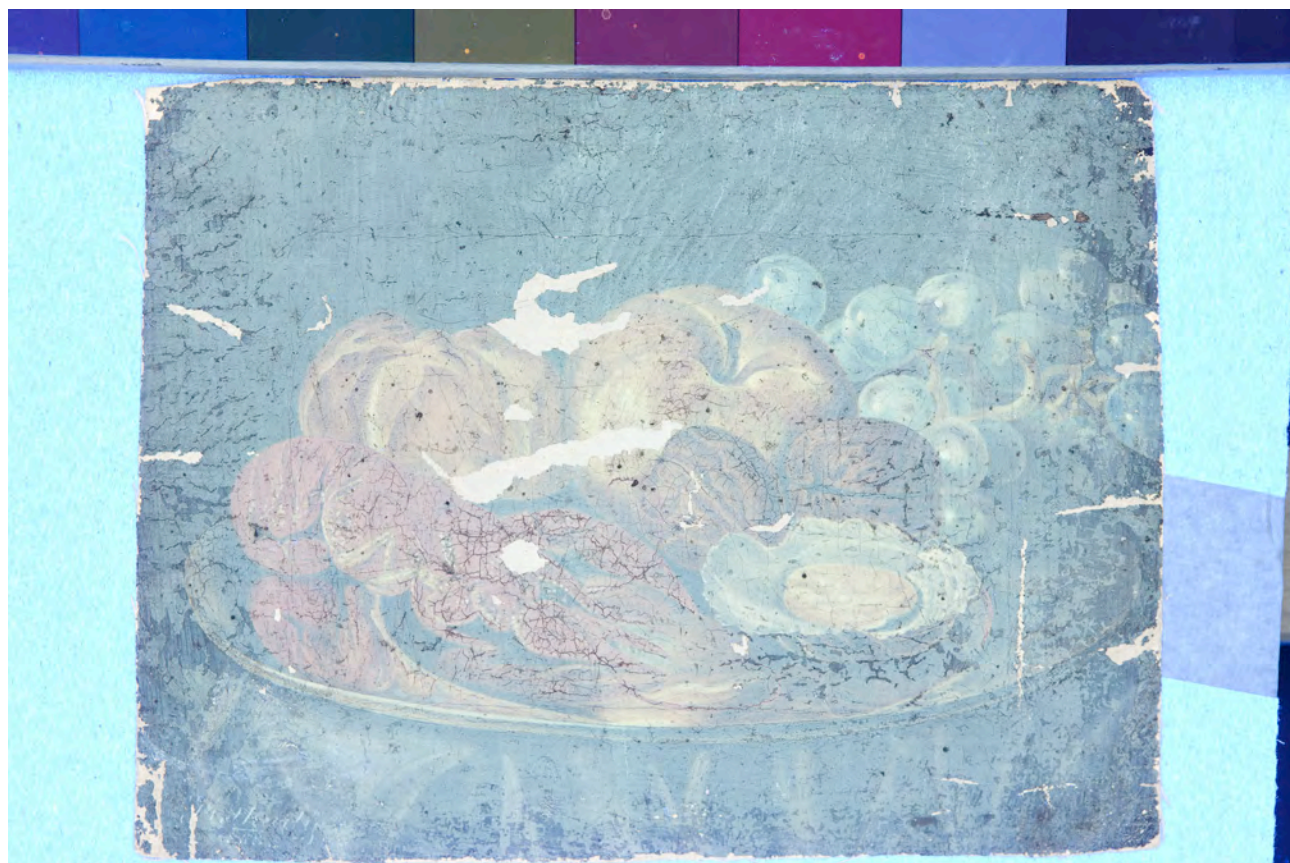
Gore: Poledina slike prije radova. Dolje: UV fluorescencija