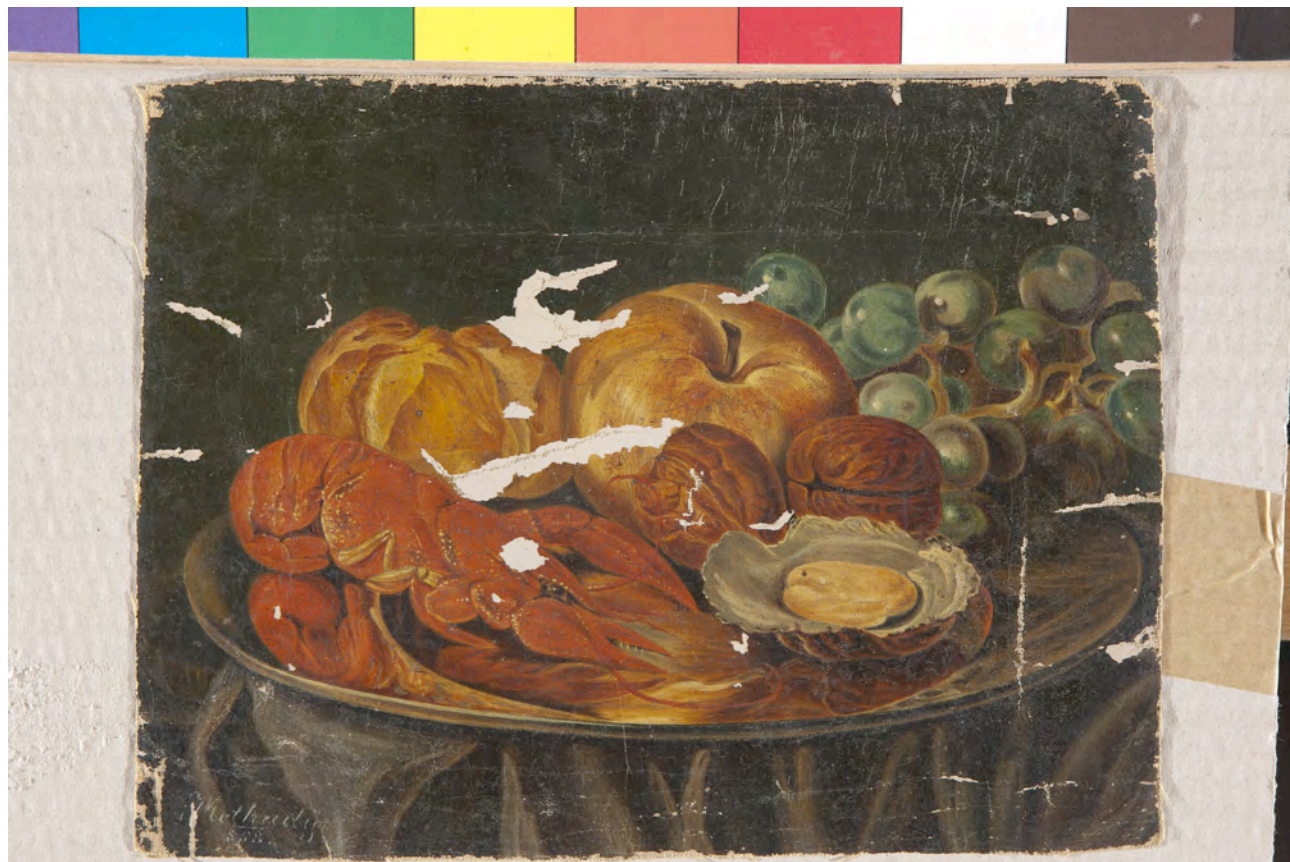
Slika prije radova

Naziv slike: Mrtva priroda Autor: Adolfo Methudy 1858. Tehnika: ulje na platnu Dimenzije: 20x26 cm (neravno rezano) Smještaj: Privatna zbirka Zagreb