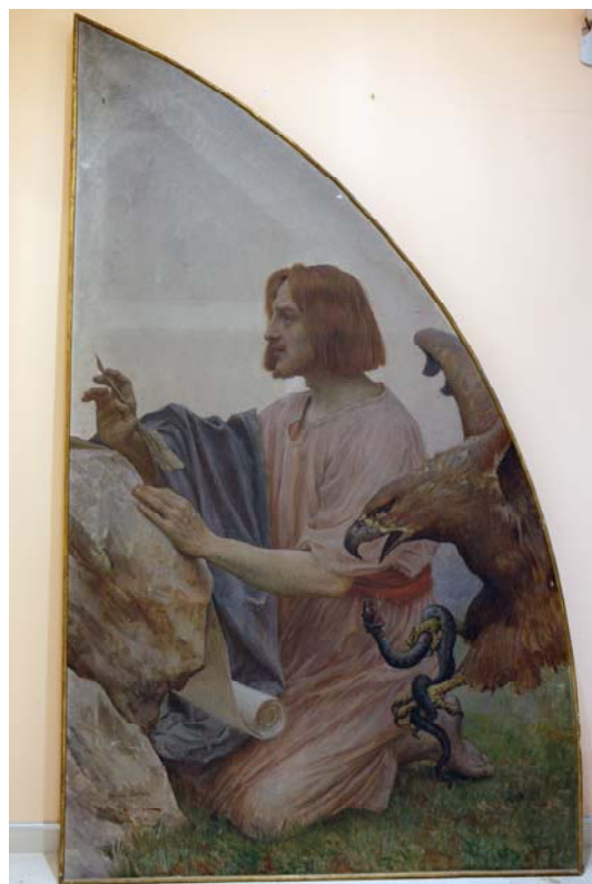
Stanje prije radova: Sv. Marko, Sv. Luka (gore lijevo su kvadratočne sonde - probe čišćenja), Sv. Ivan i Sv. Matej