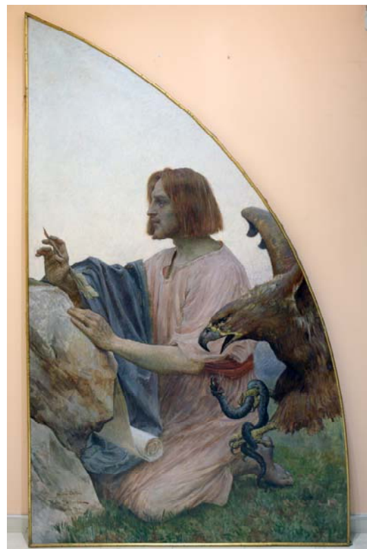
Slike nakon radova