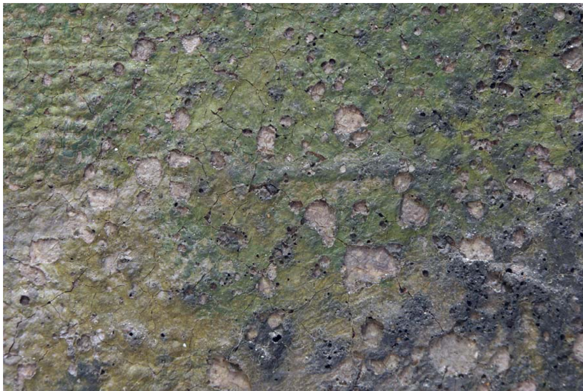
Sloj boje na slici Sv. Marko oštećen je visokom temperaturom

Bukovčeve slike četiri evanđelista već su bile restaurirane. Na slikama je prisutno više znatnijih retuša, a na slici Sv. Marko sloj boje je na desnoj strani oštećen visokom temperaturom koja je izazvala stvaranje mjehura u sloju boje. Sliku je svojedobno netko djelomično očistio, djelomično prečistio i lakirao. Na tom sloju laka nakupio se sloj nove nečistoće. Zato sada sliku treba čistiti u tri etape: 1. uklanjanje nečistoće s laka; 2. uklanjanje laka; 3. uklanjanje nečistoće ispod laka. Nakon uklanjanja sloja nečistoće, laka i nečistoće ispod laka pokazalo se da je stari retuš je znatno tamniji od izvorne boje. Znači da je onaj tko je sliku restaurirao – retuširao je nedovoljno očišćenu sliku, a istovremeno na tanko slikanim mjestima - prečišćenu sliku. Na slikama je prisutno nekoliko manjih poderotina, i više ogrebotina i oštećenja od udaraca. Zlatne ukrasne letvice aplicirane su samo na lice slike pomoću čavlića. Neke letvice su izrađene u tehnici srebra sa zlatnom lazurou, a neke u tehnici pozlate. Na slici Sv. Luka nedostaje cijela donja letvica i nedostaje nedostaje nekolicina manjih dijelova letvica na drugim slikama.