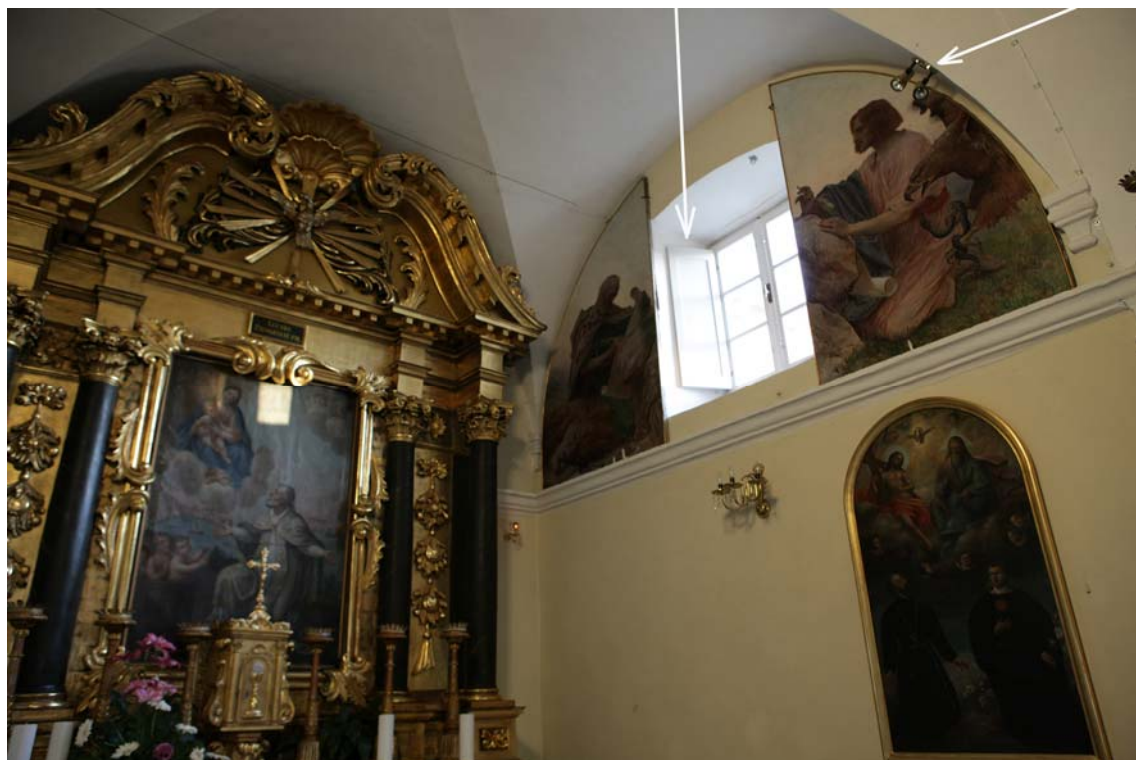
Prozor kroz koji ujesen sunce insolira retabl, a vjerojatno zimi popodne slike sv. Ivana i sv. Luke Snimljeno nakon radova.