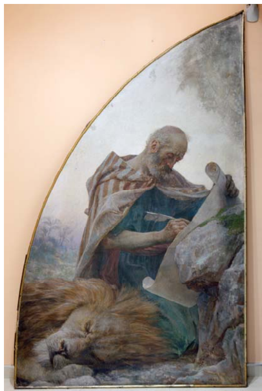
Slike nakon čišćenja. Stari tamniji retuš ,uglavnom se nalazi u gornjim dijelovima slika, naročito je opsežan na slikama Sv. Marko i Sv. Luka