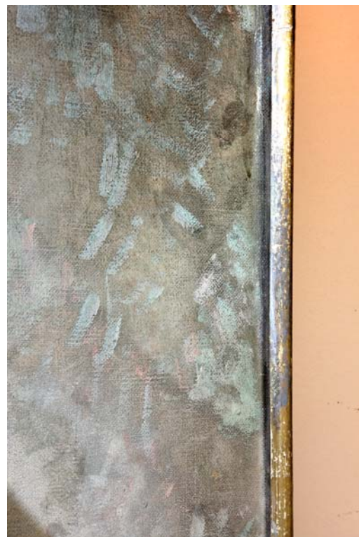
Retuš u gornjem dijelu slike Sv. Luka i u gornjem dijelu slike Sv Marko. Retuš je nanesen bez skidanja ukrasnih letvica koje su djelomično zamazane bojom. Dolje: nakon radova.