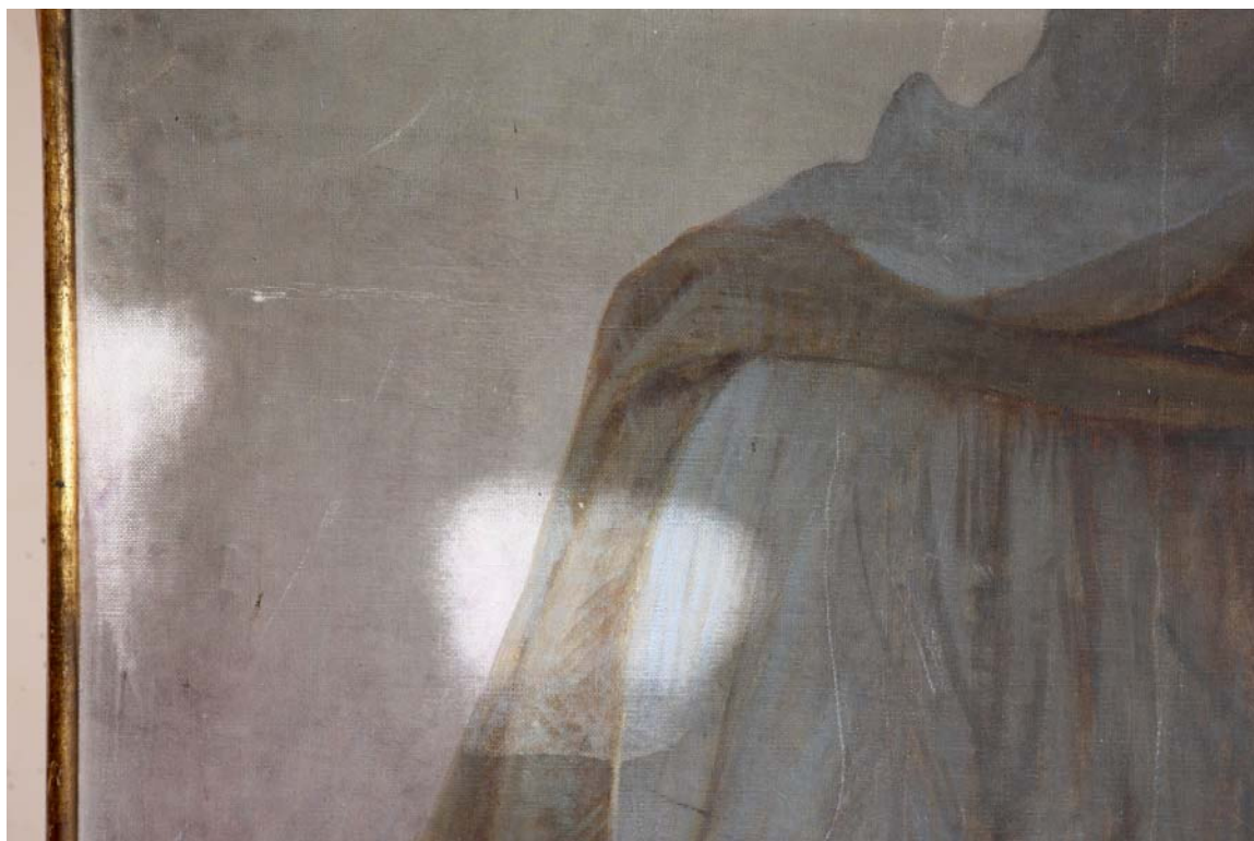
Sonde u svrhu određivanja optimalne metode čišćenja

Slika je očišćena u tri etape kako se pokazalo istražnim radovima da će jedino biti moguće i kako je predviđeno prijedlogom radova. Nakon uklanjanja sloja nečistoće pokazalo se da su stari retuši na slici znatno tamniji od izvorne boje, tj. netko je retuširao oštećenja bojom koja tonski odgovara boji izvornika sa slojem nečistoće. Taj stari retuš je dijelom uklonjen, a dijelom retuširan svjetlijom bojom koja odgovara okolnoj boji očišćene slike. Stare zakrpe papirom i flasterima zamijenjene su platnenim. Platnene zakrpe postavljene su i na one poderotine koje ranije nisu bile sanirane, a manje poderotine su sanirane varenjem niti poderotine nit na nit. Nadomješteni su svi nedostajući dijelovi zlatnih ukrasnih letvica.