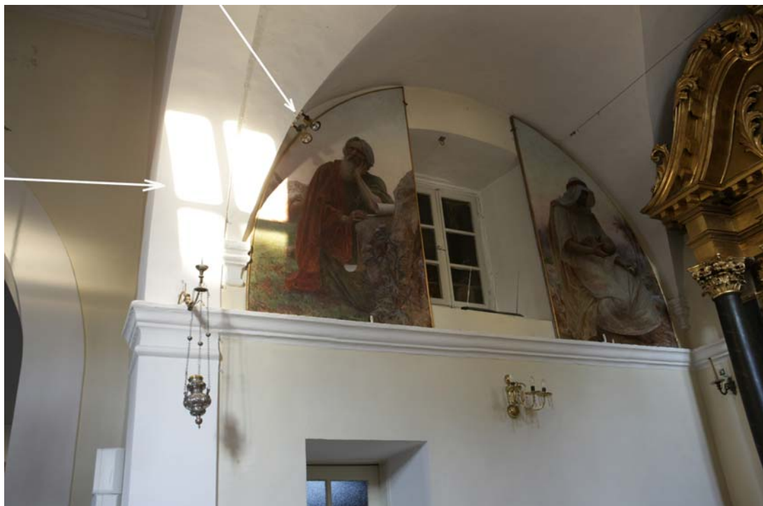
Insolacija + reflektori u neposrednoj blizini slike. Snimljeno nakon radova 18. 11. 2008. u 15 sati i 42 min