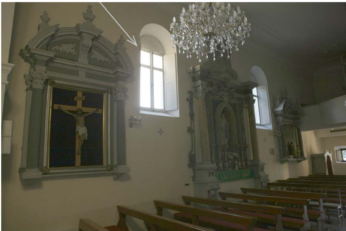
Prozor kroz koji ujesen popodne sunce insolira sliku sv. Ivana.