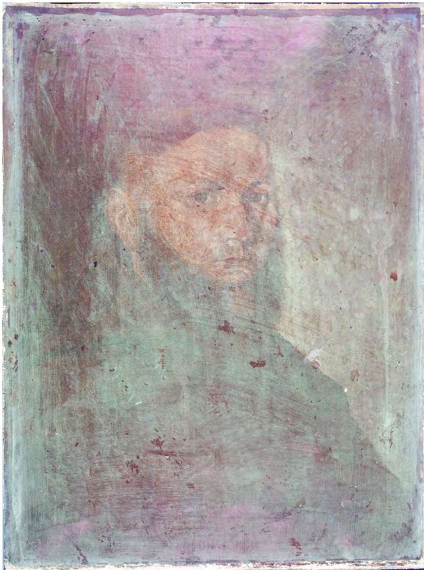
UV fluorescencija slike