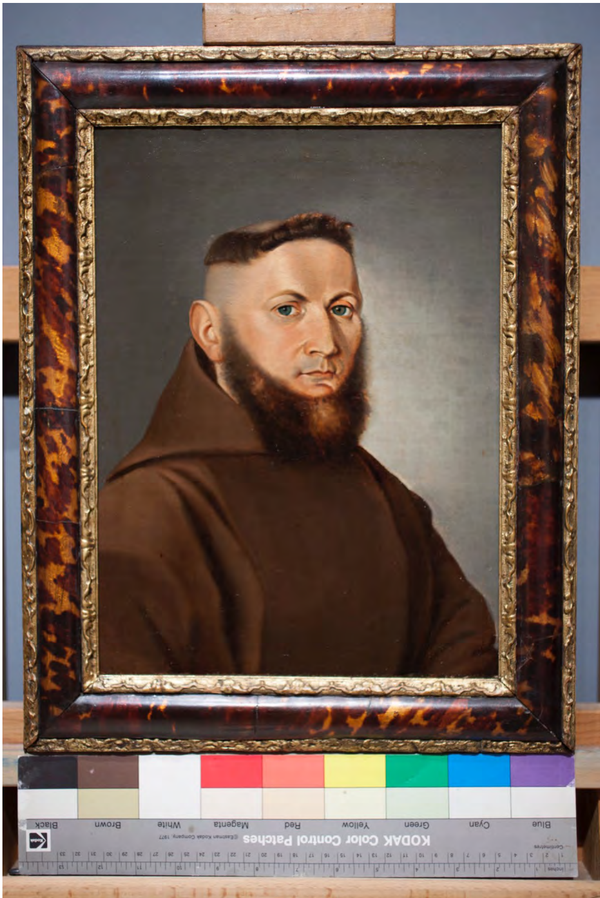
Slika u ukrasnom okviru nakon radova